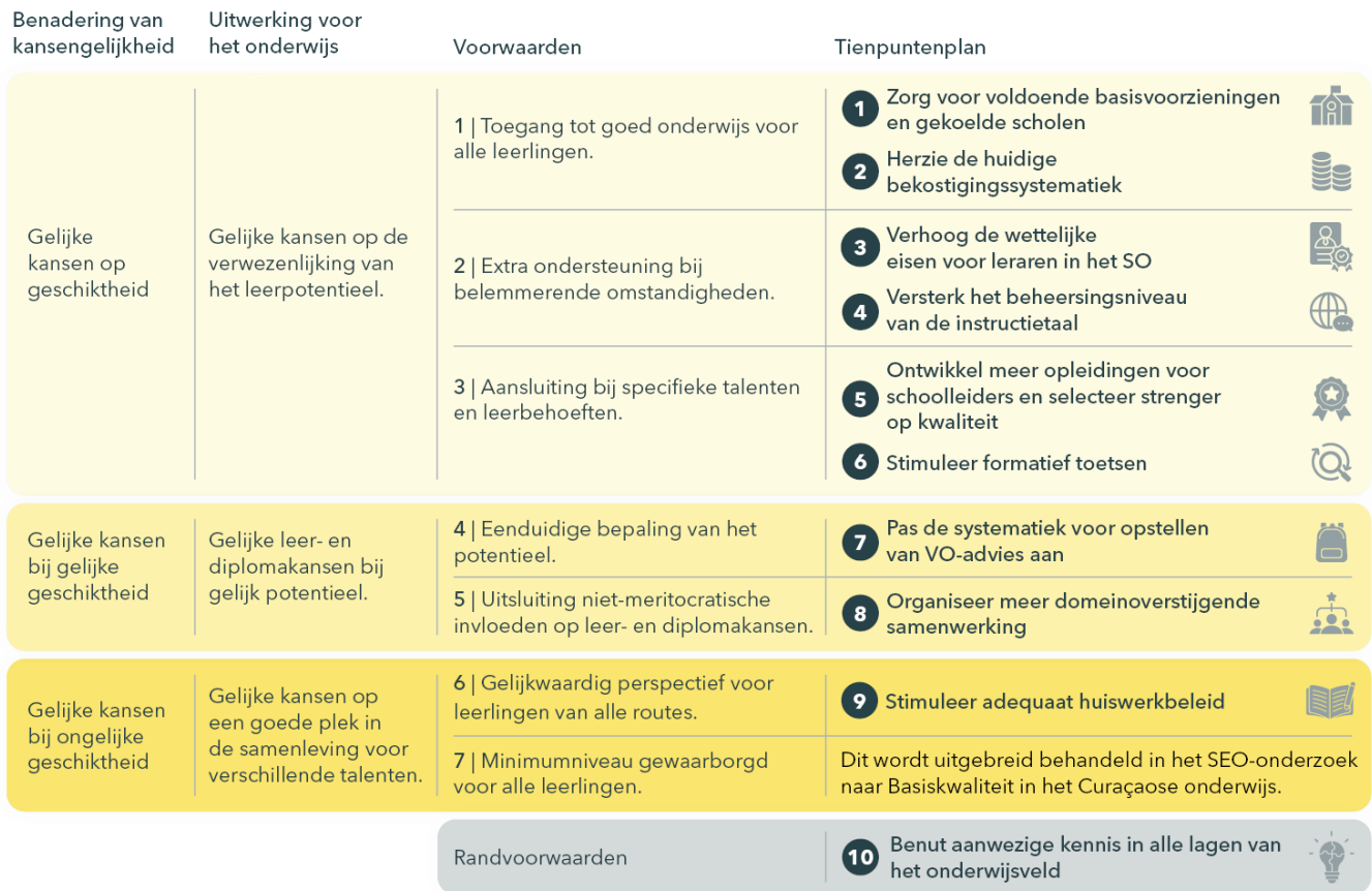
Figuur S.1. Tienpuntenplan gekoppeld aan het model-Elffers voor kansengelijkheid